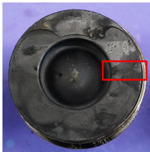
Abbildung 2: Kolben #2 mit Riss (rot eingerahmt).